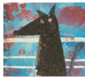
Notre petite création

En 2020, de belles rencontres sont déjà au programme ainsi que de nombreuses surprises. Dès le mois de janvier, nous accueillerons des artistes dans le cadre du festival Lis tes ratures 2020 .