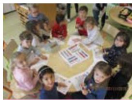
Jeux de coloriage en équipe