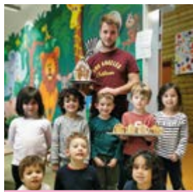
Maison en pain d'épice