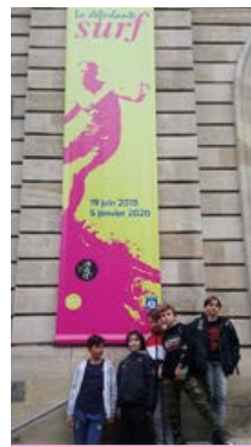
Sortie au Musée d'Aquitaine « la déferlante surf »