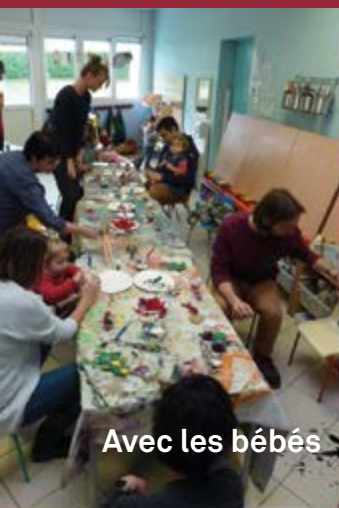
Avec les bébés