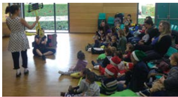
Spectacle Pétale et pigment

Et la soirée s'est prolongée : les assistantes maternelles d'Yvrac, la coordinatrice petite enfance, enfance et jeunesse et l'animatrice du Ram ont terminé cette longue et riche journée autour d'un repas dînatoire. Détente, rire et décontraction étaient au menu.