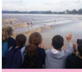
A la découverte du Mascaret