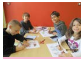
Dessins entre copains