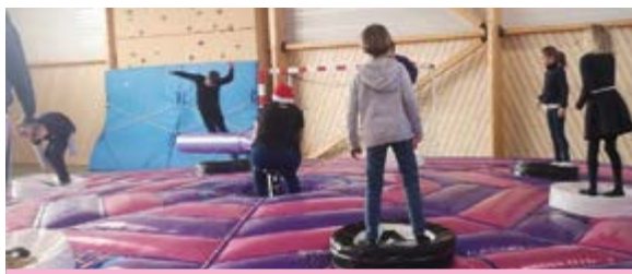
La balayette infernale

Cette année, quelques jeux extérieurs du côté des 3/5 ans devraient être installés ainsi qu'un panneau de basket-ball du côté des 6/11 ans, ce qui permettra de diversifier nos activités et partager les groupes selon leurs envies.