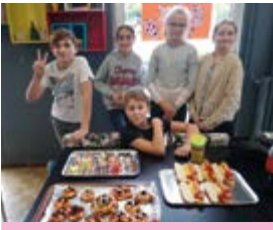
Atelier cuisine d'Halloween