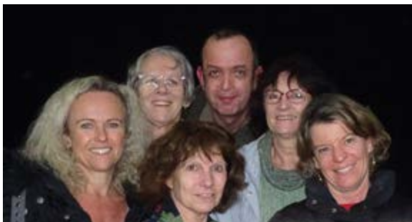
De gauche à droite :

Les Pies adultes et enfants vous présentent leurs meilleurs vœux pour l'année, qu'elle soit sereine et douce mais aussi un peu fantastique, burlesque, comique voire merveilleuse !