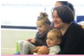
Être spectatrices en famille