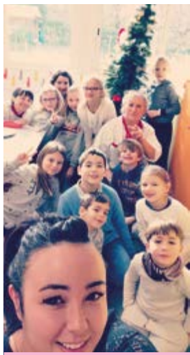
Décoration du sapin de Noël du self