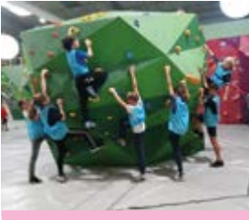
Sortie Block out