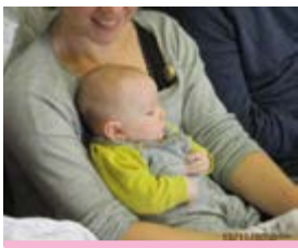
Des RDV en famille dès le plus jeune âge

2 partenaires d'expertise et de co-financement : Mairie d'Yvrac et le REAAP (Réseau d'Écoute, d'Aide et d'Appui à la Parentalité) de la CAF de la Gironde.