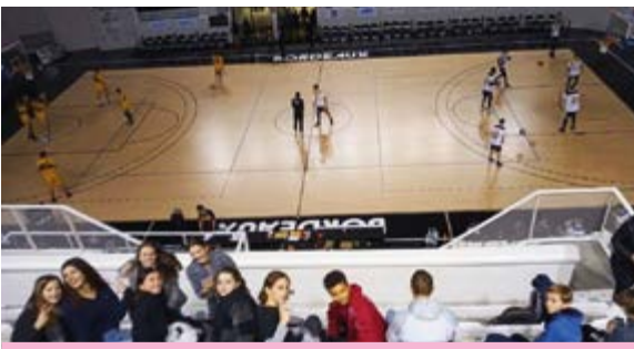
Sortie match de basket JSA Bordeaux Métropole