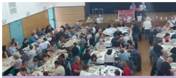
Loto du 27 octobre 2019