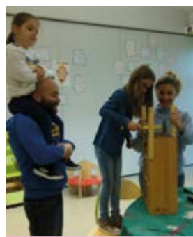
Bricolage à 8 mains