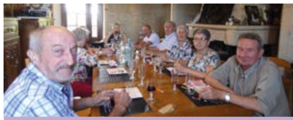
Journée en Dordogne du 15 septembre 2019