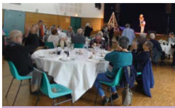
Repas spectacle du 21 décembre 2019

J'ai partagé à vos côtés pendant plusieurs années de très bons moments mais aujourd'hui je vous informe avec tout de même une pointe de nostalgie que pour