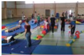
Parcours de motricité XXL