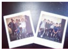
Sortie escape game