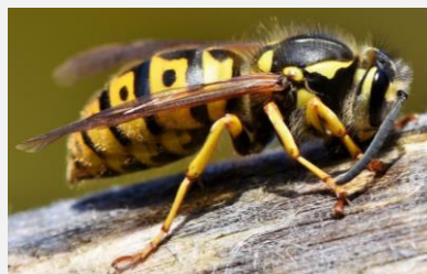
Vespula vulgaris ou « Guêpe commune »