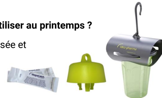
Exemples de pièges

Mélange maison : 2/3 bière alcoolisée et 1/3 sirop de fruits rouges Ou Sachets prêts à l'emploi