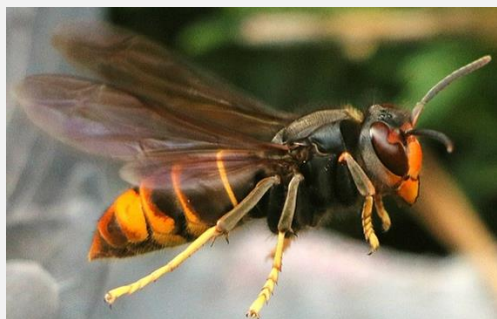
Vespa velutina nigrithorax ou « Frelon asiatique » ou « Frelon à pattes jaunes »

Thorax noir, abdomen foncé jusqu'au 4 ème segment qui, lui, est orangé.